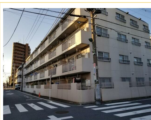
大通りから一本入った場所にあるので、うるさくありません。