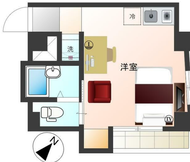
小さくても、実用的

まいばすけっと青物横丁西店まで50m, オーケー青物横丁店まで352m, miniピアゴ南品川5丁目店まで410m, セブンイレブン京急ST青物横丁店まで163m, ケンタッキーフライドチキン青物横丁店まで112m, 中華食堂日高屋青物横丁店まで165m, モスバーガー青物横丁駅前店まで162m