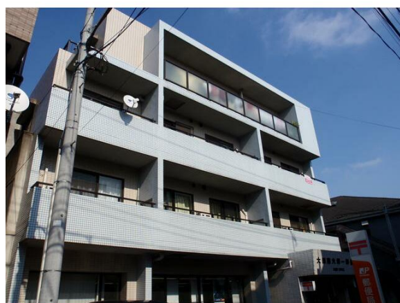
オートロック完備。頑丈なRC(鉄筋コンクリート)造マンションです。