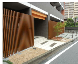
ほっとする、シンボルツリー