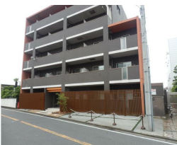
コンテスト受賞歴がある外観