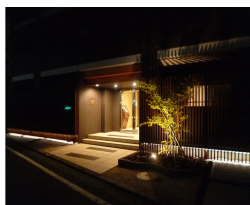
夜の雰囲気ったら、またもう