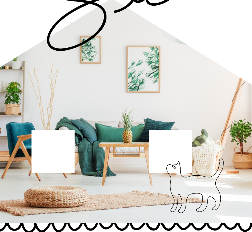
画像は、リフォームイメージです