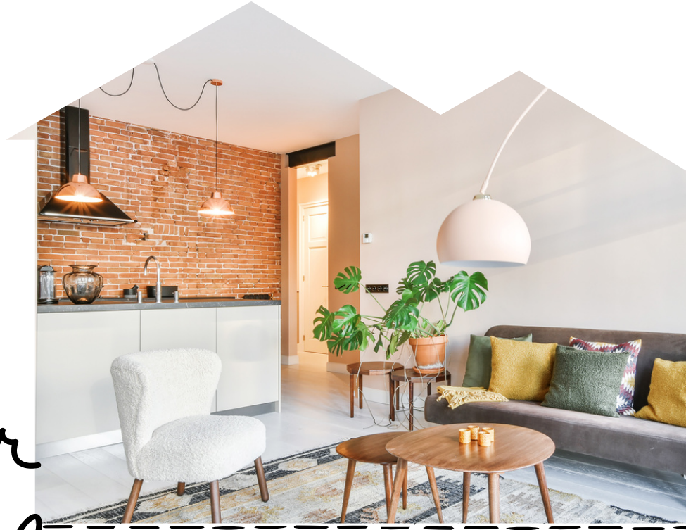
画像は、リフォームイメージです

品川駅へ直通約16分 横浜駅へ直通約25分 羽田空港第3ターミナルへ 直通約4分 通勤・通学・旅行・出張 どこへ通うにも便利な場所